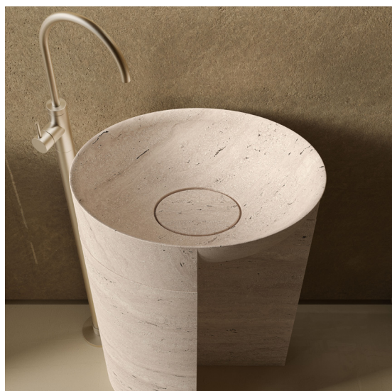
RESINA STONE DECKBLEND TRAVERTINO