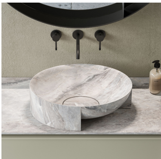
RESINA STONE DECKBLEND GRIGIO PERLA