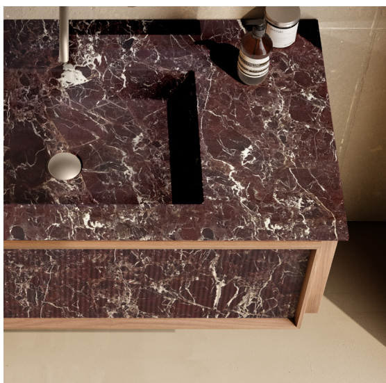
RESINA STONE DECKBLEND ROSSO LEVANTO